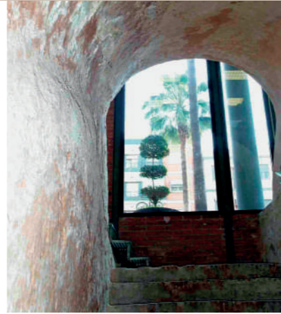
► 2 Cisterna d'Aigua (s. XVII) Plaça de la Constitució, 10

ENG Sculpture found in the Roman site of "La Ereta dels Moros". The original sculpture is displayed in the National Archaeological Museum of Madrid. An exact replica is conserved in the Municipal Auditorium Theater of Aldaia (TAMA).