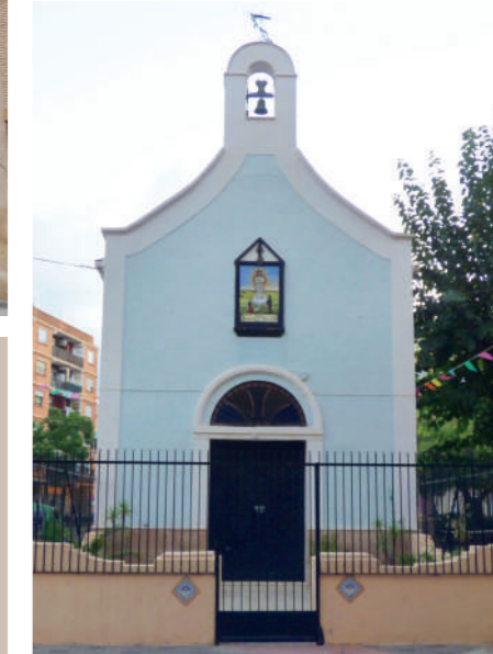
► 9 Ermita de la Mare de Déu de la Saleta (1887) Intersecció c/Saleta i Av. Hernán Cortés

VAL Ermita de la Mare de Déu de la Saleta (1887).