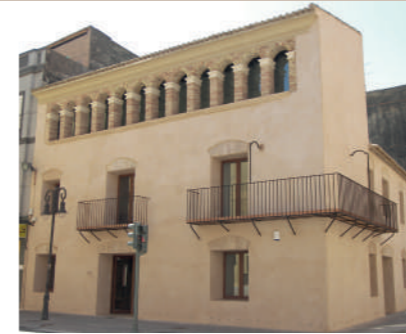
► 5 Casa de la Llotgeta - MUPA (s. XVI-XVII) Carrer Església, 2

VAL Alberga el Museu del Palmito d'Aldaia (MUPA), que posseix una excel·lent col·lecció de ventalls d'Europa i Àsia amb cronologies que van des del segle XVII fins a l'actualitat.