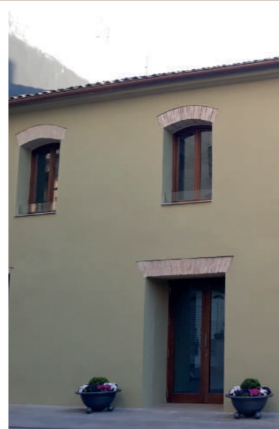
► 3 L'Antic Ajuntament (s. XIX) Plaça de la Constitució, 1

VAL Edifici restaurat que hui alberga el Centre Gent Jove, l'Espai d'Art Plaça Major i Aldaia Ràdio.