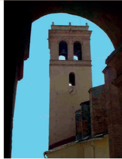
► 4 Església de l'Anunciació (s. XV i XVI) Carrer Església, 1

VAL Construïda a la fi del segle XV, els trets gòtics del temple poden apreciar-se en les nervadures de la nau principal malgrat les reformes, afegiments i decoracions posteriors.