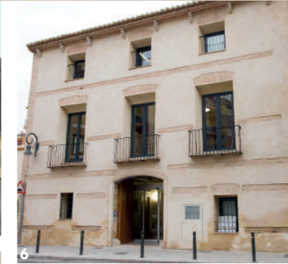
► 6 Casa de Coladors C/Coladors, 16 ► 7 Casa del Bollo C/Major, 20 ► 8 Casa del Tio Carmelo Av. Joan Fuster, s/n

VAL Habitatges típics de llaurador valencià construïts entre finals del segle XVIII i primera meitat del XX.